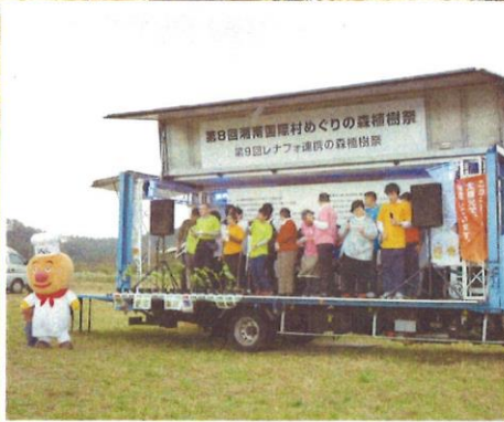
環境にやさしいソーラーパワートラック登場!