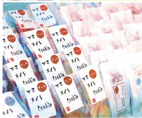
パン・お菓子販売など 楽しいテントがあります