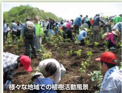
様々な地域での植樹活動風景