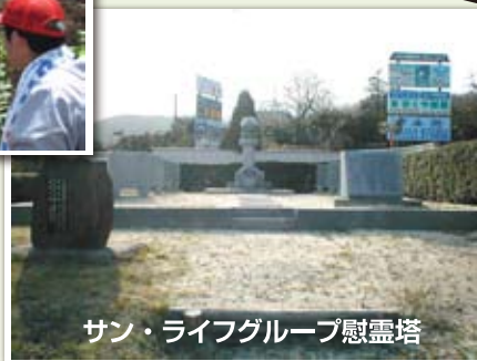
サン・ライフグループ慰霊塔