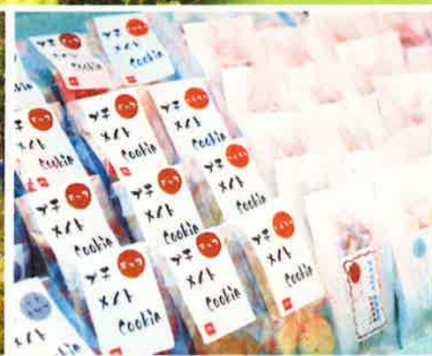
パン・お菓子販売など 楽しいテントがあります

■主 催：協働参加型めぐりの森づくり推進会議 ■共 催：いのちの源 森のもと、 特定非営利活動法人国際ふるさとの森づくり協会 ■協 賛：東京海上ミレア少額短期保険株式会社、 株式会社ラッシュ・ジャパン