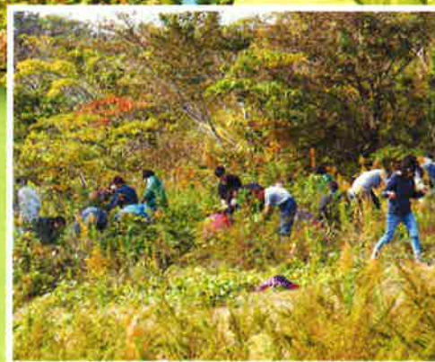
育樹 (草むしり) の様子