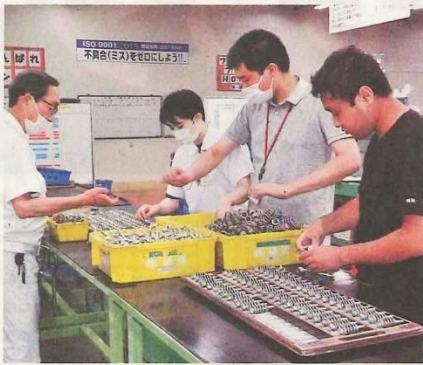
黙々と作業をこなす障害者の人たち＝神奈川県平塚市で

障害者の法定雇用率 障害者雇用促進法が中央省庁や自治体、企業に義務付けている障害者を雇用する割合。民間企業は2.2%、国や自治体は2.5%で、国は本年度中にそれぞれ0.1ポイント引き上げる予定。2019年度に達成した民間企業は全体の48%、国は約61%。国は雇用率の未達成企業から納付金を徴収し、これを財源に達成企業に助成金を支給している。06年には、在宅や福祉施設の障害者に仕事を発注する「在宅就業障害者支援制度」を導入。障害者への支払額(工賃)に応じて企業は調整金などを得られ、雇用率を達成できなかった企業は徴収される納付金からこの調整金を減額相殺できる。