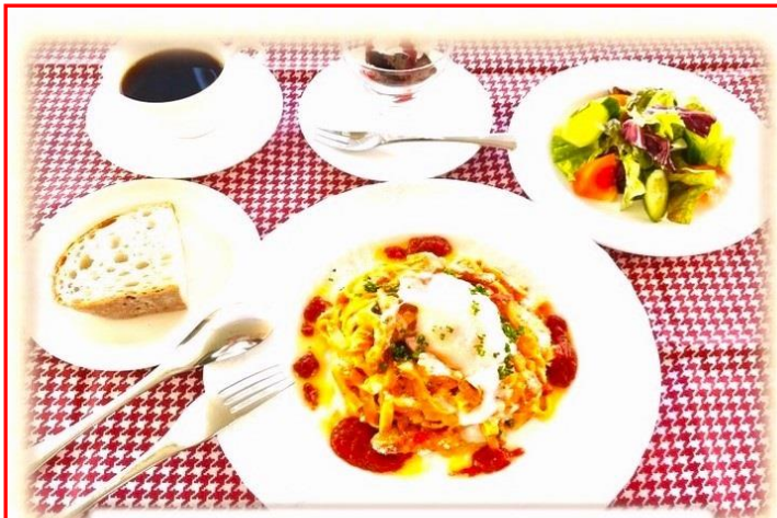
湘南とまとフェア ¥1,100 (税込み)