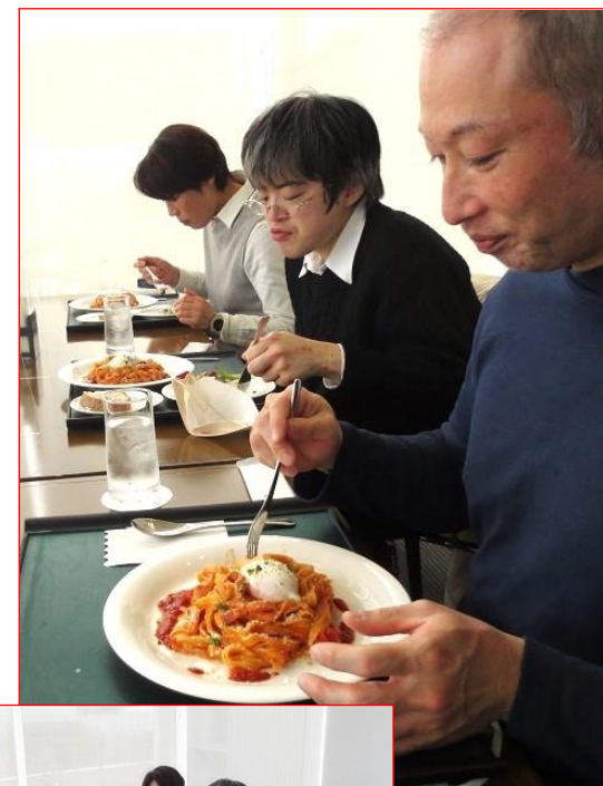
生パスタの湘南トマトカルボナーラ