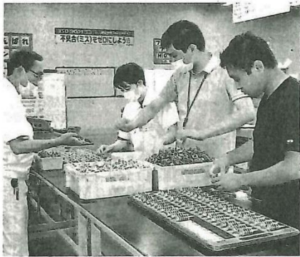
黙々と作業をこなす障害者の人たち=神奈川県平塚市で

障害者の法定雇用率 障害者雇用促進法が中央省庁や自治体、企業に義務付けている障害者を雇用する割合。民間企業は2.2%、国や自治体は2.5%で、国は本年度中にそれぞれ0.1ポイント引き上げる予定。2019年度に達成した民間企業は全体の48%、国は約61%。国は雇用率の未達成企業から納付金を徴収し、これを財源に達成企業に助成金を支給している。06年には、在宅や福祉施設の障害者に仕事を発注する「在宅就業障害者支援制度(工賃)」を導入。障害者への支払額(工賃)に応じて企業は調整金などを得られ、雇用率を達成できなかった企業は徴収される納付金からこの調整金を減額相殺できる。