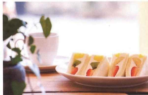
ホットケーキパーラー湘南リトルツリー／ともしびショップ湘南平 神奈川県平塚市万田790-24 Tel:0463-34-7041 https://shonanlittletree.wixsite.com/home f @SHONAN.Little.Tree i @shonan.little.tree t @sh_little_tree