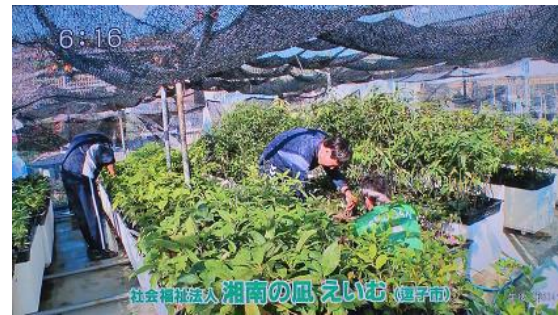
6:16 社会福祉法人 湘南の風 いむ (園子市)