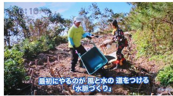
6:16 最初にやるのが 風と水の道をつくる「水脈づくり」