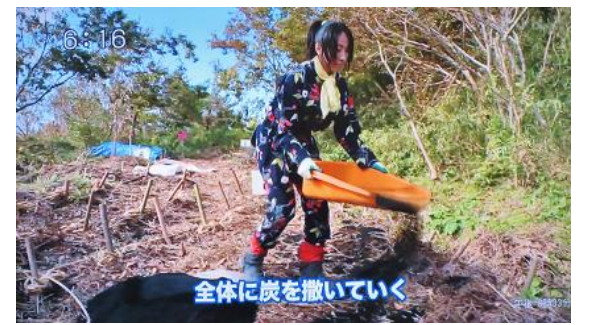
6:16 全体に炭を撒いていく