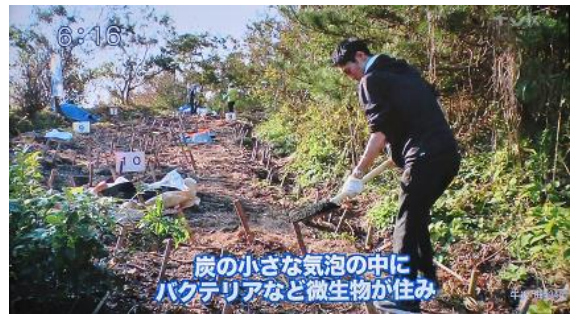
6:16 炭の小さな気泡の中に バクテリアなど微生物が住み