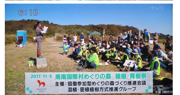
2017/11/5 湘南国際村めぐりの森 植樹・育樹祭 主催: 協働参加型めぐりの森づくり推進会議 混植・密植植樹方式推進グループ