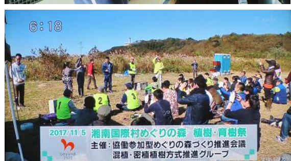
2017/11/5 湘南国際村めぐりの森 植樹・育樹祭 主催: 協働参加型めぐりの森づくり推進会議 混植・密植植樹方式推進グループ