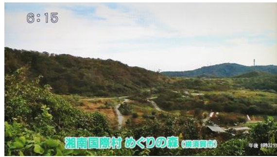
湘南国際村めぐりの森 (風景写真)