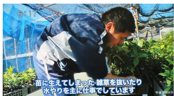
6:17 苗に生えてしまった雑草を抜いたり 水やりを主に仕事でしています