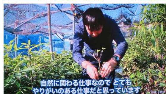
6:17 自然に関わる仕事なので とても やりがいのある仕事だと思っています