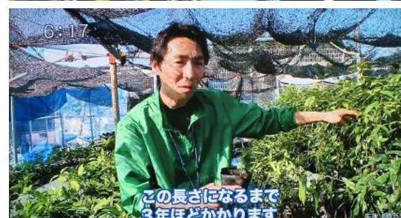
6:17 この長さになるまで 3年ほどかかります