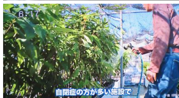
6:17 自閉症の方が多い施設で