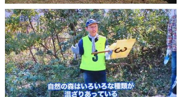
6:18 自然の森はいろいろな種類が 混ざりあっている