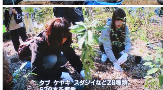
6:18 タブ ケヤキ スダジイなど28種類 620本を植樹