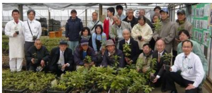
宮脇昭先生を囲んで / 進和学園「どんぐりハウス」

自然の森は色々な種類が混ざり合っている。 これが生物社会の掟。人間社会も一緒。 仲の良いものだけを集めても駄目。 混ぜる、混ぜる、混ぜるんです。