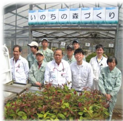
タバコの苗を出荷

立派な巨木も、元々は一粒の「どんぐり」でした。私達のささやかな取り組みも何れ芽を出し、成長して行くことを信じて「いのちの森づくり」の輪を広げて参りたいと思います。皆様のご理解ご支援を賜れば幸いです。